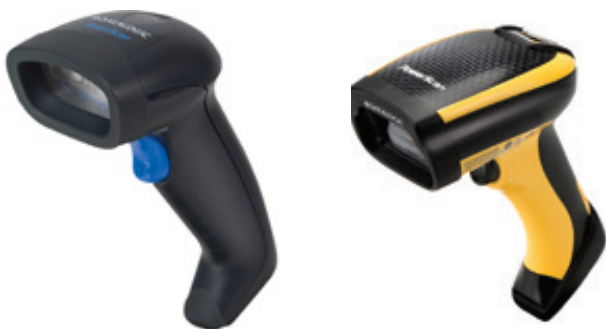
Quickscan MP-2430-KA Datalogic