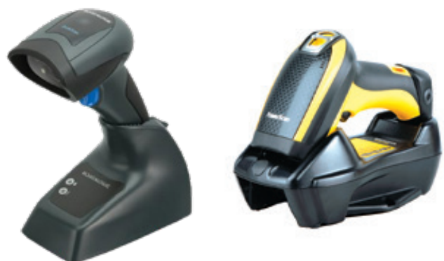
Quickscan MP-2430-BT Datalogic

Funkübertragung / BT Basisstation mit USB